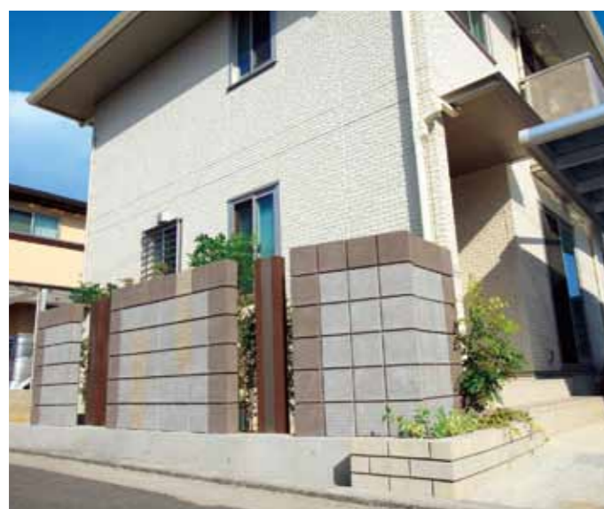
リード(ココアブラウン、アンバーホワイト)/テフ(エクルベージュ)