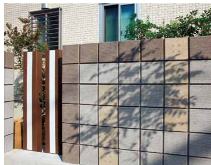
リード(ココアブラウン、アンバーホワイト)/テフ(エクルベージュ)