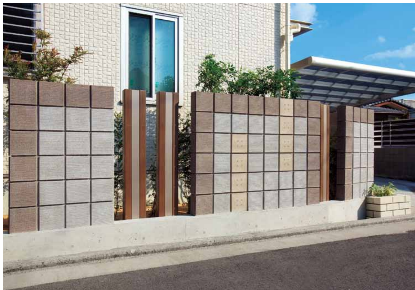
リード(ココアブラウン、アンバーホワイト)/テフ(エクルベージュ)